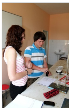
V chemické laboratoři