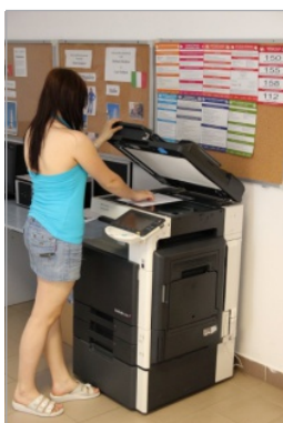
Barevná tiskárna a kopírka pro žáky