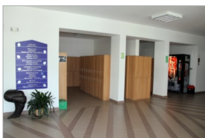
Vstupní hala a skříňky žáků

ZVEME VÁS NA DEN OTEVŘENÝCH DVEŘÍ VE STŘEDU 3. 2. 2016 OD 13.00 do 17.00 VE VŠECH PROSTORÁCH GYMNÁZIA